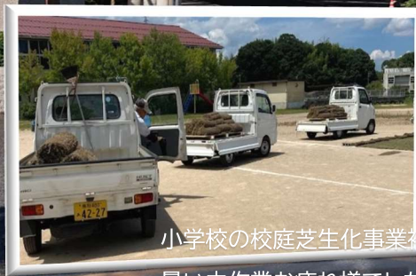
小学校の校庭芝生化事業補助作業の風景です。暑い中作業お疲れ様でした。

7月末会員数 529名 (前月比 +7名) (男性337名 平均年齢 74.4歳 最高年齢 92歳) (女性192名 平均年齢 73.7歳 最高年齢 93歳)