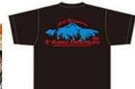
Tシャツの素材は吸汗速乾タイプ