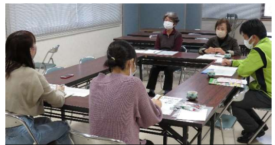
米子市シルバーワークプラザ 会議室

センターの女性会員の活躍に着目し、現場で就業する女性会員の生の声と事務局職員の話、センターの広報活動について話を聞かせてほしいとの依頼があり、女性部から2名の会員、事務局からは潮次長が対応しました。卒論のテーマにシルバー人材センターを選んでもらえ学生の役に立つことができ良かったと思います。